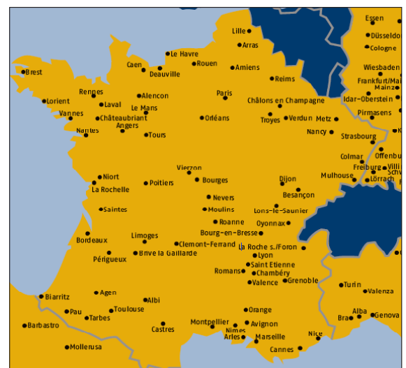
LIEUX DES FOIRES ET SALONS